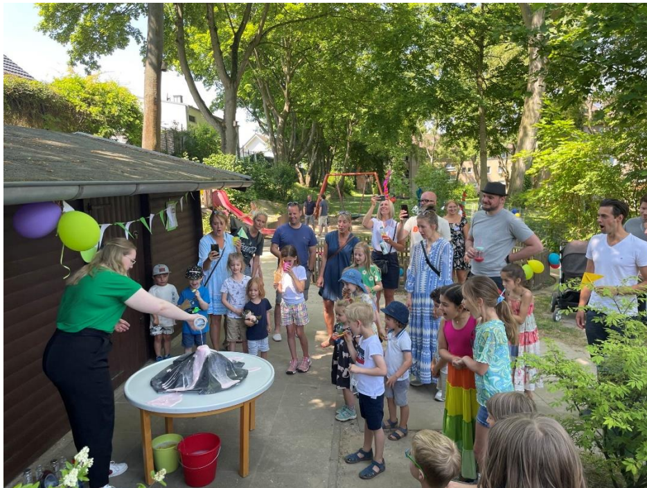
Abbildung 12 Vulkanausbruch beim Forscherfest

Vater-Kind-Nachmittag, Wandertag, Großelternnachmittag, Forscherfest, Eltern-Kind-Turnen.