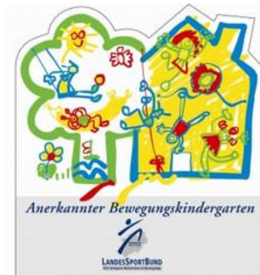
Abbildung 8 Anerkannter Bewegungskindergarten

Krabbeln, kriechen, klettern, springen – Kinder brauchen Bewegung. Für eine gesunde körperliche Entwicklung, aber auch um sich zu entdecken und ihre Persönlichkeit zu entfalten. Kinder die sich bewegen, sind innerlich beteiligte Kinder. Sie nehmen ihren Körper wahr, finden ihr inneres Gleichgewicht und sind ausgeglichener.