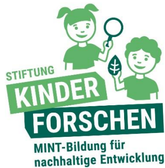
Abbildung 10 Kinder forschen

Durch die regelmaige Begegnung mit Naturwissenschaften und Technik erfahren unsere Kinder bewusst sie umgebende Phanomene, entdecken Neues aus eigenem Antrieb heraus und lernen mit Freude und Begeisterung.