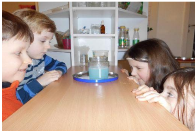
Abbildung 11 Projekt "Sprudelgase"