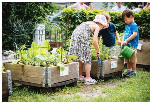
Abbildung 7 Naschgarten

Unser Projekt: Der Naschgarten!! Unsere Kinder sollen im Naschgarten körperlich aktiv sein und essbare Pflanzen kennen und mögen lernen. Was motiviert mehr, Obst und Gemüse zu essen, als der Stolz auf die eigene Ernte von selbst gepflanzten Äpfeln, Erdbeeren oder Kohlrabi? Sie erfahren, wie frisch geerntetes Obst und Gemüse schmeckt, wann es wächst und wie es geerntet wird. Sie erlernen einen respektvollen Umgang mit ihren Mitmenschen und mit der Natur. Außerdem ist Naschen für Kinder oft etwas, das sie sich wünschen, das aber mit Verboten und Einschränkungen verbunden sein kann. Wir wollen einen Ort schaffen, an dem unbesorgt genascht werden kann, genascht von den Früchten des Gartens. Einen Naschgarten also.