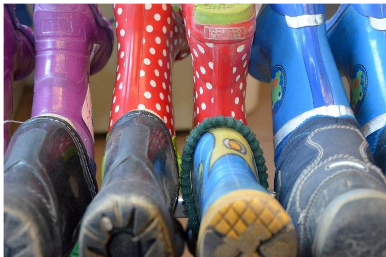
Abbildung 2 Für schlechtes Wetter, gibt es gute Kleidung

14.00 – 16.00 Uhr Kinder, die 45 Stunden im Kindergarten verbleiben spielen, gestalten oder tummeln sich auf dem Außengelände.