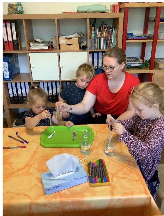
Abbildung 5 Gemeinsam forschen

Das Kind als „Akteur der eigenen Entwicklung“ zu verstehen, bedeutet für uns als pädagogische Fachkraft, dass wir in der Verantwortung stehen, den Kindern entwicklungsförderliche Bedingungen zu schaffen. Es geht dabei um die Personen-, Raum- und Materialqualität. Um den hohen fachlichen Anforderungen langfristig genügen zu können, ist die Bereitschaft zur Auseinandersetzung mit der eigenen Persönlichkeit sowie zur regelmäßigen Reflexion des pädagogischen Handelns im Sinne der Qualitätssicherung unverzichtbar.