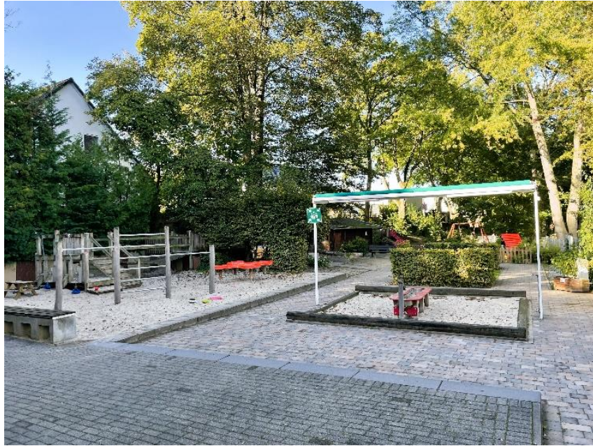
Abbildung 1 Blick auf das Außengelände