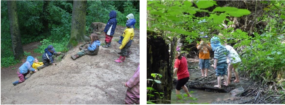
Abbildung 6 Ausflug im Bornekampwald