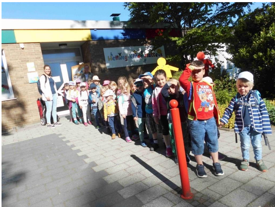
Abbildung 4 Ausflug zum naheliegenden Spielplatz