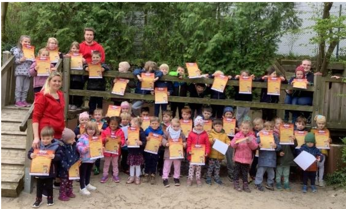
Abbildung 9 Minisportabzeichen

In der heutigen Zeit des Fernsehens, der Computer und Gameboys, ist es unserem Team wichtig, den Kindern Zeit und Raum für Bewegung zu ermöglichen. Wir gehen mit jeder Gruppe in altersgemischten Kleingruppen 2x wöchentlich turnen. Darüber hinaus dürfen die Kinder (in Kleingruppen bis zu vier Kindern) die Turnhalle und ihre Bau- und Klettermöglichkeiten in kleineren Gruppen nutzen, sofern diese nicht belegt ist (wir bieten eine offene Turnhalle und einen offenen Spielplatz). Bewegungserziehung findet jedoch nicht nur in speziellen Turnstunden statt, sondern auch beim Spiel, eigentlich immer dann, wenn Bewegungsfreunde aufkommt und der Bewegungsdrang möglichst ungestört ausgelebt werden kann.